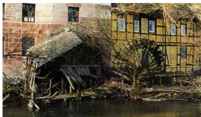
Stillgelegtes Wasserkraftwerk - Sündenfall einer verfehlten Energiepolitik.

Der Mensch nutzt die treibende Kraft des Wassers bereits seit Jahrtausenden. Beispiele dafür sind Mühlen und Schöpfräder. Wo heute Strom für die umliegende Bevölkerung erzeugt wird, stand früher oft